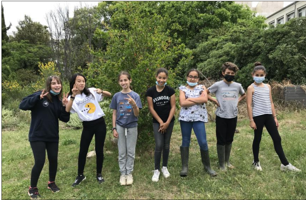
Photographie de quelques éco-délégués devant un arbre qu'ils ont planté.